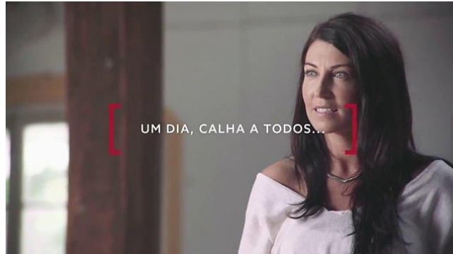
Publicidade da Fidelidade; Electricista