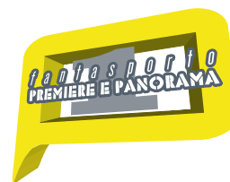
“Première e Panorama” Grandes estreias e primeiras obras