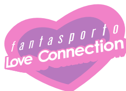
“Love Connection” Cinema romântico e erótico