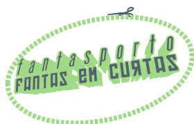
“Fantas em Curtas” Curtas e médias-metragens