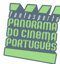
“Panorama de Cinema Português” Cinema Português