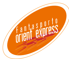
“Orient Express” Cinema de países asiáticos